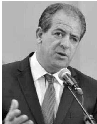
هذا السياق: "بالنسبة للتدريبات، طلبت الهيئة الدولية وضع أربع قاعات تحت تصرفها، نحن حضرنا ثمان قاعات من أجل تسهيل مهمتها

وقد تم تخصيص قاعات عين البنيان والأبيار وبرج الكيفان والكاليوتوس وبراقي والشرافة وبن عكنون (المركز النسوي) وقاعة الحماية المدنية بالدار البيضاء لاحتضان الحصص التدريبية، وتشارك في موعد الجوائز ابتداء من يوم الثلاثاء المقبل، منتخبات 16 بلدا تم تقسيمها على 4 مجموعات تتنافس من أجل التأهل للدور الرئيسي، حيث تتواجد الجزائر (البلد المنظم) ضمن المجموعة الرابعة رفقة منتخبات كرواتيا، إسبانيا، السويد، الأرجنتين والمغرب. وختم الوزير قائلا: "تضع كل منتخبنا في منتخبنا الوطني الذي سيبدل كل ما في وسعه لتحقيق أفضل النتائج الممكنة، أناشد الجمهور بالتثقل بقوة لتدعيم كل الدعم لهذه التشكيلة الشابة". للتذكير، تضم المجموعة الأولى منتخبات ألمانيا والنرويج والمجر وكوريا الجنوبية والشيلى وجزر الفارو، بينما تشكل المجموعة الثانية من منتخبات فرنسا والدانمارك ومصر وسلوفينيا والسويد وقطر. أخيرا، تتواجد ضمن المجموعة الثالثة منتخبات إسبانيا وتونس والبرازيل وبوركينا فاسو ومقدونيا وروسيا.