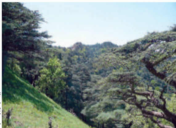
ما بين الكيفان بتيسمسيلت