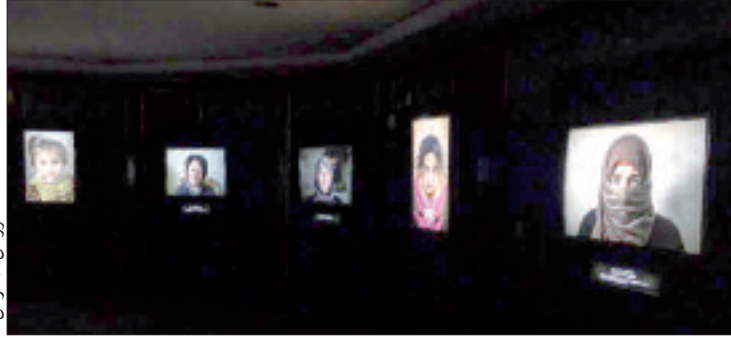
معرض من المصورين