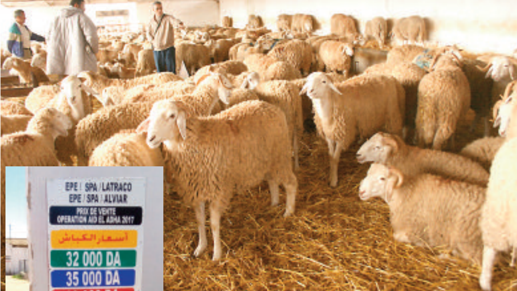
أسعار الأضاحي بمقر شركة «لاتراكو»