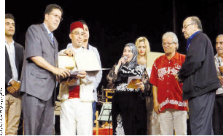
اختتام مهرجان الأغنية الوهرانية

ليتواصل الحفل بتقديم الفنانة رميسة شبيخي إحدى روائع الفنان المرحوم أحمد وهي "محال نفرقنا لحوال" إلى جانب أغنية "مشي مرة"، وأغنييتين للفنان معطي الحاج بعنوان "زين الوهرانيات" و"طال عذابي"، فيما كان ختام المهرجان يصعد الفنان الكبير رحال الزبير، الذي قدم رائعة "راني محتر"، وسعدى بسعيدة، والتي لم يؤدها أمام الجمهور منذ سنة 1973. وقد تم تكريم كل من الفنان رحال الزبير والفنان الشعبي الشيخ نونة، عرفانا بما قدماه للفن الوهراني.