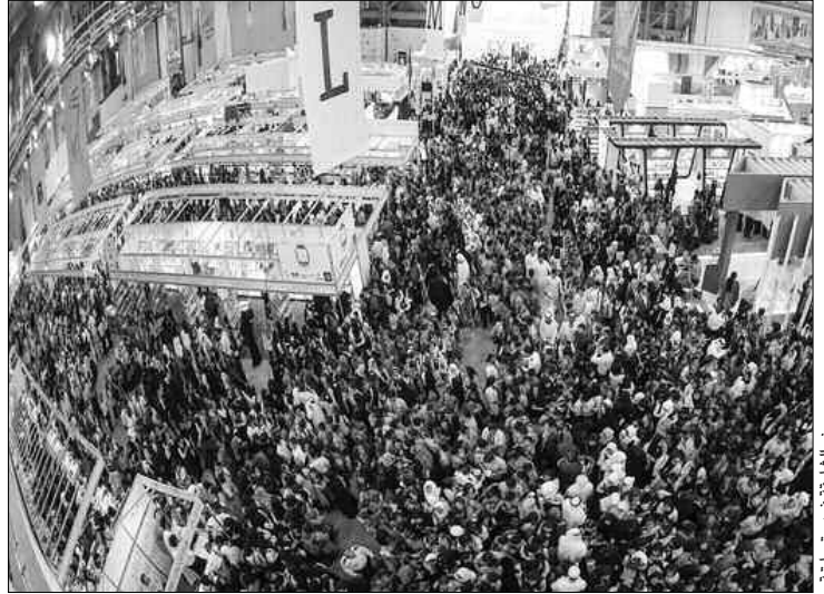
معرض الشارقة في دورة سابقة

بالمتخصصين في مجال النشر، إلى جانب إقامة جلسات لعقد اتفاقيات بين المشاركين في البرنامج. وسيحتل المعرض إقامة الدورة الرابعة من مؤتمر المكتبات، بالتعاون مع جمعية المكتبات الأمريكية أيام 7 و8 و9 نوفمبر 2017، بمشاركة عدد كبير من أمناء المكتبات من المنطقة والولايات المتحدة ودول أخرى، ويشمل العديد من الفعاليات والجلسات التي تتناول مواضيع مهمة لأمناء المكتبات الأكاديمية والعامة والمدرسية والحكومية والخاصة.