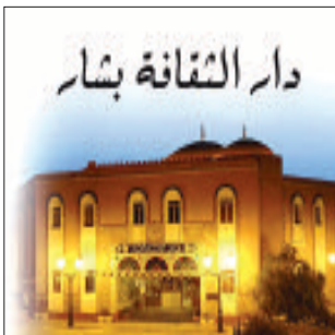
دار الثقافة ببشار

حدد آخر أجل لاستقبال المشاركات بالفاصح نوفمبر الإعلان عن مسابقة أيام بشار الفيلم القصير