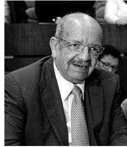
ويخصوص الملف الليبي، وإذ أكد بأن الجزائر ستكون موجودة في طرابلس عن قريب، في إشارة إلى إعادة فتح سفارة الجزائر بليبيا، جدد بن صالح التزام الجزائر بمواصلة جهودها لحل الأزمة الليبية، مذكرا بالزيارة التي قادت المبعوث الجديد للأمين العام للأمم المتحدة إلى ليبيا، غسان سلامة، مؤخرا إلى الجزائر، «حيث كان هناك مشاور وتبادل للأراء حول ما يبذل من جهود لتطبيق اتفاق 17 ديسمبر الفارط وتلك المبدولة من طرف دول الجوار أو الجزائر من أجل جمع شمل الليبيين والعمل على حل الأزمة في إطار سياسي توافقي ما بين كل الأطراف المتنازعة في هذا البلد الشقيق»

بموقف المنظمة التي «برهنت أنها موحدة وتتكلم بصوت واحد». وأكد في نفس السياق بأن الرد على هذه المحاولات اليائسة، تأتي من الدول الإفريقية ذاتها، مؤكدا بأن محاولة الطرف الغربي في مالاو فشلت وكذلك في الموزمبيق كان لها نفس المصير، قبل أن يضيف «مهما تكررت هذه المحاولات سيكون مآلها الفشل». وأشاد وزير الخارجية بالموقف الذي تبناه الاتحاد الإفريقي تجاه ما حصل، في الموزمبيق، حيث «برهنت إفريقيا على أنها موحدة وتعمل حقيقة كل ما اتفق عليه رؤساء الدول والحكومات وتتكلم بصوت واحد». مذكرا بأن الاتحاد الإفريقي متكون من 55 دولة بما فيها الصحراء الغربية والمغرب.