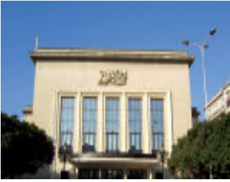
المسرح الجهوي غناية

برمجت إدارة المسرح الجهوي عز الدين مجوبي بعناية، عدة عروض موجهة للأطفال، تحسبا للدخول المدرسي الجديد، حيث سيكون الجمهور الصغير بداية من يوم الجمعة القادم، على موعد مع الفرجة والتمتيع ببعض المسرحيات الهادفة والتربوية، كما سترافق الألعاب الهلوانية الصغار خلال الموسم الدراسي، حيث ركز شركاء القطاع الثقافي على تنوع العروض المقدمة مع استقدام فرق ناشطة في المسرح من الولايات المجاورة، تعريف الطفل بأهمية المسرح الذي يدخل في إطار تربية وتنشئة التلميذ ومساعدته على الإبداع واكتشاف عالم الخيال عنده. وفي سياق متصل، ستستظم المكتبة الرئيسية للمطالعة العمومية معرضا لبيع الكتاب المدرسي، ابتداء من اليوم وإلى غاية نهاية الشهر الجاري. إضافة إلى كتب متنوعة في مجالات مختلفة مثل الرياضيات، الفلسفة والأدب، إلى جانب القصص الشعبية، على غرار لونية والغول والأميرة وكذا القصص التربوية، مثل قصة "الحديقة الساحرة".