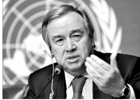
تقرير مصيره في سياق ترتيبات يكفل لشعب الصحراء الغربية (جبهة البوليساريو والمغرب) بما تتماشى مع مبادئ ميثاق الأمم المتحدة ومقاصده.

أكد الأمين العام للأمم المتحدة انطونيو غوتيريس ضرورة إنهاء النزاع في الصحراء الغربية معرباً عن التزامه بإطلاق عملية التفاوض بين طرفي النزاع (البوليساريو والمغرب) بهدف التوصل إلى حل سياسي يكفل لشعب الصحراء الغربية المحتلة حق تقرير مصيره.