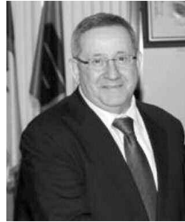
من جهة أخرى، قام الرئيس المدير العام لسوناطراك بتفقد أشغال إنجاز محطة الضغط وإعادة ضخ الغاز بالسريرية في حاسي مسعود، والتي تسجل لأشغالها تأخرا كبيرا.