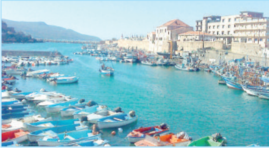
منظر عام للقالة