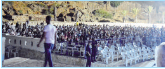
مسرح الهواء الطلق