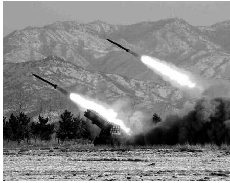
الإمكانيات النووية العسكرية لبلاده.

ورد الجيش الكوري الجنوبي بإعلانه لإطلاق صاروخين من طراز «هيونمو-2» من أحد المواقع القريبة من الحدود بين سول وبيونغ يانغ وذلك بعد ست دقائق من إطلاق صاروخ الشطر الشمالي. وأشار مسؤول في هيئة الأركان المشتركة الكورية الجنوبية إلى أن أحد الصواريخ أصاب الهدف بدقة في البحر الشرقي على بعد 250 كلم، موضحة أنها نفس المسافة بين موقع تدريب القوات الكورية الجنوبية وقاعدة «سونان» التي أطلقت منها كوريا الشمالية الصاروخ النووي متوسط المدى. ولكن المبعوث الأمريكي لشؤون نزع السلاح في الأمم المتحدة روبرت وودي قال إن الولايات المتحدة «تريد الإبقاء على جميع الخيارات