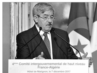
4 ème Comité intergouvernemental de haut niveau France-Algérie Hôtel du Matignon, le 7 décembre 2017

وبعد أن ذكر أن الجالية الوطنية في الخارج تزخر بالعديد من الكفاءات ورؤوس الأموال والمقومات الأخرى، أوضح الوزير الأول أن الجزائر بحاجة إلى أفرادها «لاستثمار داخلها» بمن فيهم الخواص، ومشير إلى أن كل مساعي لم شمل الجالية الوطنية من الوطنيين ومزدوجي الجنسية وجزائري الأصل المندمجين في النظام السياسي والاقتصادي والاجتماعي الفرنسي، ستكون مسكبا لكل من أجل إسماع صوتكم والدفاع عن حقوقكم».