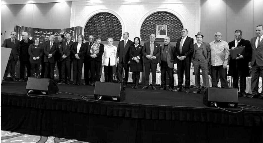
جانب من الحفل

تمنح الجائزة الكبرى لآسيا جبار (تبلغ قيمتها 1 مليون دينار جزائري) لأحسن عمل روائي في اللغات العربية والأمازيغية والفرنسية، وهي من تنظيم المؤسسة الوطنية للاتصال، النشر والإشهار، بالشراكة مع المؤسسة الوطنية للفنون المطبعية «إيناك» وهما مؤسستان عموميتان تعملان بالتعاون مع ناشري وطنيين.