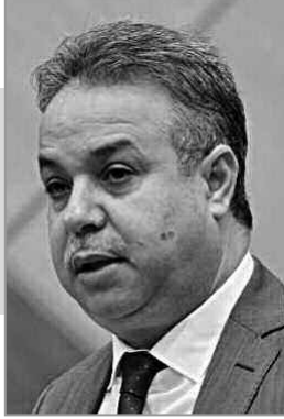
عبد الوحيد طمار

وأكد وزير السكن والعمران والمدينة عبد الوحيد طمار ووزير الاتصال جمال كعوان أن الزيارة التفقدية على أهمية الإعلام بصفة عامة ووسائل قطاع السمي البصري بصفة خاصة في التسويق الإعلامي لهذا المعلم الديني والثقافي وتغطية ونقل فعالياته، وإبراز أهميته وقيمته الجمالية بالنسبة لمدينة الجزائر، مشيراً إلى أن هذا المعلم يعد مركزاً للجذب العلمي بأنواعه والديني والثقافي والسياحي، من حيث كونه معلماً حضارياً سيضفي لمسة جمالية خاصة على العاصمة.