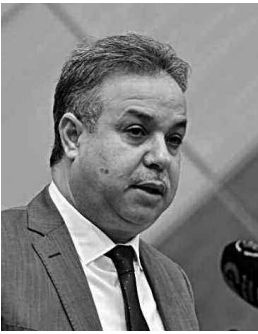
عبد الوحيد طمار

كشف وزير السكن والعمران والمدينة عبد الوحيد طمار أمس، أن مراجعة قانون التعمير المقررة في غضون العام الجاري، ستشمل دمج القانون 08/15 الذي يحدد قواعد مطابقة البنائيات وإتمام إنجازها فيه، كقاعدة ثابتة، معلنا من جانب آخر، أن التسجيلات ضمن صيغة الترقوي المدعم التي سيتم إطلاقها قريبا، تتم على مستوى البلديات.