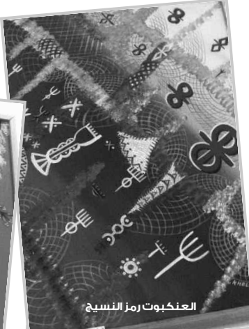
العنكبوت رمز النسيج

وعن عصافير السنونو، الذي يهاجر من المناطق الباردة إلى الدافئة، فقال محدثنا أنه يعدّ رمزا للسفر والهجرة، أما «الكوفي» أو الجرة، فرمز للتوفير والادخار، لكونها تجمع الخيرات ولا يجوع مالكاها في البيت خلال موسم تهافتل