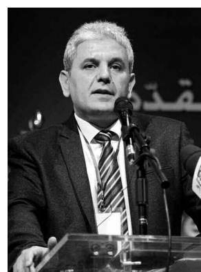
فيمّا أعلن خلاله الرئيس السابق والعضو

نصب رئيس التجمع من أجل الثقافة والديمقراطية محسن بعباس أمس، أعضاء الأمانة الوطنية للحزب وذلك في ختام المؤتمر الخامس الذي تم خلاله إعادة انتخاب بعباس رئيسا وكذا انتخاب تشكيلات الهياكل القيادية للأقسام.