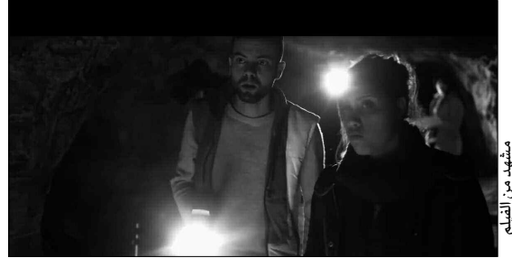
مشهد من الفيلم

وأكد مخرج الفيلم، بعد عرض الفيلم، أن الهدف من إنجاز هذا العمل الفني، هو إثراء الساحة الفنية السينمائية الجزائرية بهذا النوع من الأفلام الذي يغيب تماما عن المكتبة الجزائرية رغم أن هذا النوع من الأفلام يحتل مكانة شعبية كبيرة لدى الجمهور الجزائري، ويعرف إقبالا كبيرا من طرف الجزائريين الذين يتلفهون على مشاهدة أفلام الرعب الأجنبية، مضيفا أنه أراد رفقة طاقم الفريق، المساهمة ولو بشكل بسيط في النهوض بسينما الرعب في ساحة تغلب عليها السينما التاريخية والاجتماعية. للإشارة، عمار زغاد، هو مخرج ومنهج سينمائي جزائري، من مواليد 1979 بقسنطينة، عُرف منذ صغره ببغفه للسينما، تلقى في سن مبكرة تكوينا في الموسيقى لكن سرعان ما تحول اهتمامه إلى فن التصوير الفوتوغرافي، حيث عمل على تطوير مهاراته من خلال إجراء البحوث والدراسات المعمقة حول تقنيات التحقيق، قبل أن يتمكن من تأسيس شركة الإنتاج السمعي البصري، والتي أطلق عليها اسم "قسنطينين"، تيمنا باسم مدينة قسنطينة. كما شارك سنة 2015 في إخراج فيلم "سيرا عشي السسر" ثم "خفايا قسنطينة" سنة 2016، قبل أن يخرج سنة 2017 أول فيلم طويل له من نوع الرعب تحت عنوان "ميم".