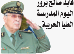
قائد صالح يزور اليوم المدرسة العليا الحربية

يقوم الفريق أحمد قايد صالح، نائب وزير الدفاع الوطني رئيس أركان الجيش الوطني الشعبي اليوم، بزيارة عمل إلى المدرسة العليا الحربية، حيث سترأس حسب بيان لوزارة الدفاع الوطني الدورة الحادية عشرة للمجلس التوجيهي للمدرسة طبقا لأحكام المرسوم الرئاسي المؤرخ في 26 سبتمبر 2006، المتضمن إحداث المدرسة العليا الحربية.