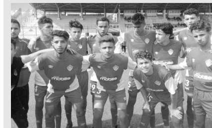
• م. عبيد