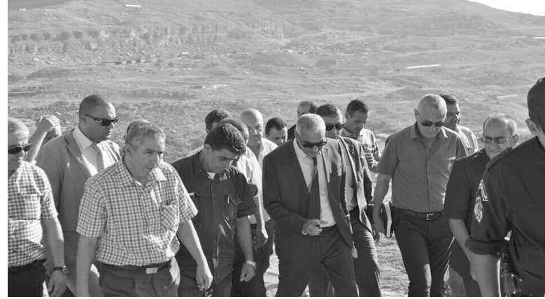
الجزائرية للمياه مطالبة بالتنفيذ