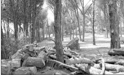
للسنة الفارطة 492 قنطاراً من الفلين.