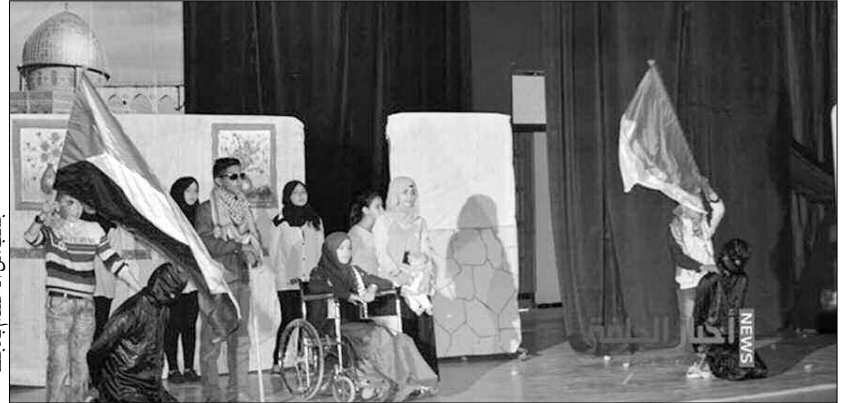
جانب من اختتام بالجلفة

في المكتبة الرئيسية للمطالعة العمومية "مبارك بن صالح" ببيلة، تم خلاله توزيع الجوائز على الأطفال الفائزين في مختلف الورشات الفنية والمسابقات الفكرية التي نظمت بمناسبة هذه التظاهرة، التي انطلقت يوم الأحد المنصرم. أسدل الستار على هذه الطبعة التي تميزت بإقامة معرض للمكتب بمشاركة عدد من دور النشر المعروفة، وسبع ورشات في فن الحكواتي الصغير والرسم والخط العربي، يحفل حضور عدد كبير من الأطفال المتواجدين في عطلة. شملت حفل اختتام التظاهرة، فرقة من المهرجين تابعة لجمعية "ميلاف" للمسرح الحر، كما قدمت مجموعة من الأناشيد المدرسية والأغاني الملزمة التي حظيت بتجاوب واسع من الجمهور الذي اكتظت به القاعة.