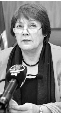
ألف كتاب للثانويات الـ 50 المتفوقة في البكالوريا

من جهة أكد وزير الثقافة عز الدين ميهوبي، أن اللقاء كان فرصة لوضع تقييم أولي لسنة ونصف من نضرة تنفيذ الاتفاقية، لا سيما ما تعلق بتضمين المناهج الدراسية المحتوى الأدبي الجزائري، حيث عملت لجنة مشتركة تضم كتابا وأباء جزائريين مختصين. حسبته في وضع المناهج الدراسية لإدراج عدد كبير من أسماء الأدبية الجزائرية لمختلف الأجيال ككتاب بلغات مختلفة، «بغية منع روح وهوية جزائرية للمناهج المدرسية».