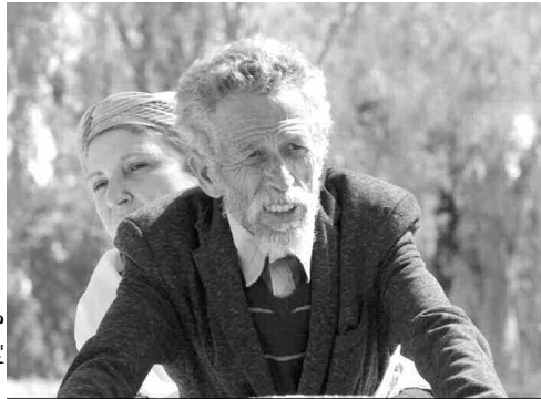
في مسابقة الأفلام الوثائقية الطويلة

ومنعت لجنة التحكيم جازرتها الخاصة للفيلم المصري «رحلة البحث عن أبو العربي» لإخراج أكرم الزواوي.