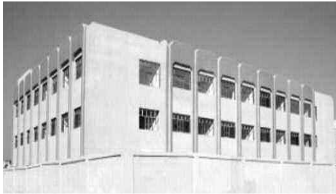
بيداغوجي، أكثر من 85٪.

من جهة أخرى، أطلقت الولاية عددا معتبرا من المشاريع التربوية في الأطوار الثلاثة بكل من التوسعة الغربية للمدينة الجديدة علي منجلي، منطقة الرتبة بديوش مراد والمدينة الجديدة ماسينيسا، بالإضافة إلى القطب السكني عين نحاسي، وهي التجمعات التي استقطبت وتستقطب عددا كبيرا من السكان، بعد الترحيلات الأخيرة والسكنات المبرمجة من أجل التوزيع في مختلف الصيغ خلال الأشهر المقبلة.