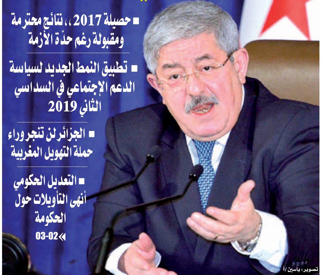
تصوير: ياسين / 1