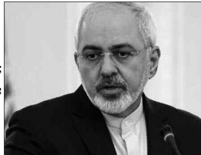
محمد جواد ظريف

يذكر أن الرئيس الأمريكي وضع الدول الموقعة على الاتفاق النووي في مأزق حقيقي، حيث تباينت مواقفه الرافضة لمواصلة العمل ببنوده ومواقف الدول الداعمة العضوية الأخرى في مجلس الأمن وألمانيا الرافضة هي الأخرى لفكرة إعادة النظر في مضمون الاتفاق. وطالب وزير الخارجية الإيراني مسؤولي هذه الدول بالضغط على الرئيس ترامب، من خلال تأكيد موقفهم الرافض لإعادة النظر فيه حتى في حال انسحبت الولايات المتحدة منه بهدف المحافظة على مصداقية المجموعة الدولية كلما تعلق الأمر بقضية ذات بعد عالمي.