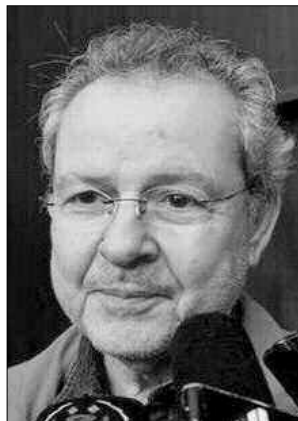
هذا الفيلم الذي نال جائزة "التانيت الذهبي" في مهرجان "أيام قرطاج السينمائية" بتونس في 1978.

لوحده في إنتاج الفيلم، لذا على السينمائيين البحث عن موارد أخرى، كما يفعل المصريون واللبنانيون والتونسيون. أكد المخرج مزراق علاش أن السينمائيين الجزائريين الشباب يعانون اليوم كثيرا في إنتاج أعمالهم، بينما كان جيله رغم المصاعب، محاطا بـ "طاقم" من رجال متعاون مع الفنانين.