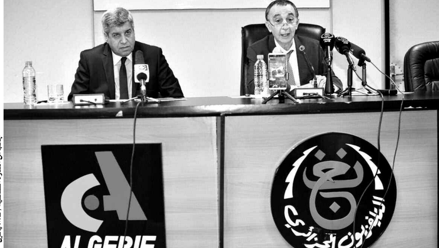
الجنرال من الندوة الصحفية / ت.أ. ياسين

«مسمم المطبخ» و«كوزينا ميام ميام» وغيرهما. وتشارك المحطات الجهوية في مجهود الإنتاج الداخلي ببرامج ثقافية وبمجموعات مثل «قعدة لحباب» من وهران، وسهرات الجنوب من ورقلة وبنشار. كما أكد خلادي أن أقوى البرامج وأحسن المختارات ستكون موجودة على الموقع الرسمي للتلفزيون. أما في ما يتعلق بالمسابقة الرمضانية فستكون ضمن حصة «داشر بلادي» التي ستتقل إلى 30 دشرة عبر الجزائر العميقة، وفي كل يوم يطرح السؤال على المشاهدين، وهو «أين تقع هذه القرية؟».