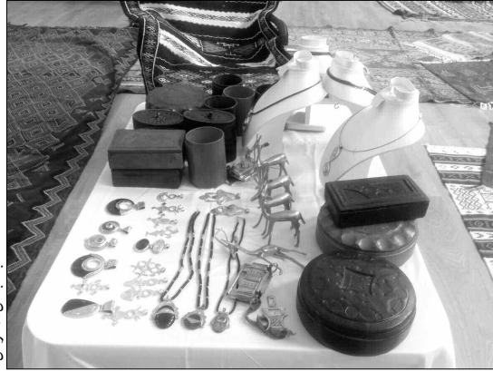
جانب من المعرض

كرام الشاحنة التي تقل الزرابي، مواسلا جهاده في سبيل متابعة درب أجداده وجداته، للحفاظ على هذا التراث الذي يتراجع بصفة رهيبه، ومع ذلك، تحاول ابنته الصغيرة تعلم النسيج من والدتها، في زمن لم يعد في كل بيت بغرداية منسج، ولم تعد كل نساء عاصمة ميزاب، تحسن النسيج. عن مواصلة النساء لهذه الحرفة، قال محفوظ بن سليمان، إن المرأة وحدها من يمكن أن تقوم بنسج الزربية، نظرا لصبرها اللامتناهي وطول بالها، خلافا للرجل، فهي تظل لساعات طويلة، تنسج صوف الغنم وتخرج بتخف بتخركل بيت بامتلاكها، ليعود ويؤكد على خطورة اضمحلال وزوال هذه الحرفة، ليس في غرداية فقط، بل حتى في مدن أخرى، مثل تلمسان والأغواط، فهل من منقذ؟