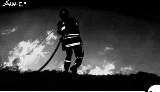
• ج. بوبكر

سخرت محافظة الغابات بولاية سعيدة 13 برج مراقبة، إضافة إلى 10 فرق متنقلة و7 أخرى للتدخل الأولي، وهذا تجسبا للحرائق التي تشهدها الولاية خلال كل صائفة، لاسيما بالمناطق الجبلية والوعرة على غرار مناطق بوب والحساسة. كما أحصت المصالح 42 نقطة مياه قريبة من الفضاءات الغابية لاستخدامها في حال نشوب الحرائق. للإشارة، أحصت مصالح محافظة الغابات بولاية سعيدة، خلال جوان 2017، 10 حرائق أقت على أكثر من 312 هكتارا من المساحات المحروقة بالمنطقة، من بينها 91 هكتارا من الأحرار و63 هكتارا من الغابات و88 هكتارا من الأدغال فضلا عن 71 هكتارا من الحطاة.