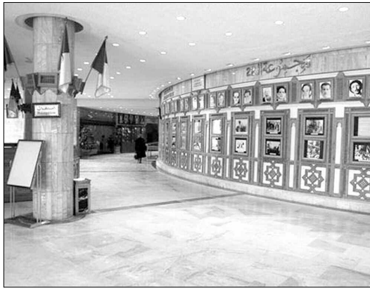
المتحف الوطني للمجاهد

المجاهد محمد كشود، تلاها على الساعة الرابعة والنصف عرض فيلم وثائقي بعنوان "المفاوض الجزائري" من إنتاج وزارة المجاهدين، وتم دعوة أساتذة مختصين وشخصيات تاريخية وباحثين وطلبة ومجاهدين وإطارات من عدة قطاعات وزارية إلى جانب الأسرة الإعلامية. يقام أيضا ضمن هذه الاحتفالية معرض تاريخي بمنزلة "الصايبات"، حيث يتوافد الزوار بكثرة علما أن الذكرى تزامن والعطلة الصيفية، وقالت "الوزارة" هي من حددت هذا الموقع الذي يشهد إقبالا كبيرا من مختلف المناطق، ويشهد الإقبال خاصة في الفترات المسائية من