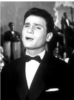
عبد الحليم حافظ

بعثت السيدة لمياء محمود رئيسة شبكة صوت العرب لجريدة "المساء" تسجيلا يتجاوز 71 دقائق للراحل عبد الحليم حافظ، تضمن إعلانه عن نتائج استفتاء الاستقلال في 3 جويلية 1962، وبيعت بهتانيه للشعب الجزائري الذي صوت بـ"نعم" وهديته رافعته "فجر الجزائر".