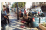
تتكون من 5 طوابق بـ 47 شارع طرابلس (بلدية حسين داي)،

متأثرا بالهجرة المتساقطة على رأسه. وجندت مصالح الحماية المدنية سيارة إسعاف وشاحنة، وتم نقل الضحية إلى مصلحة حفظ الجثث بمستشفى بشير متوري بالقبة، في انتظار مواصلة التحقيق من قبل المصالح المعنية في تحقيقات هذا الانهيار الخطير.