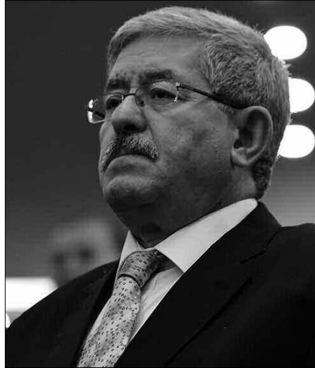
جمال ولد عباس، خلال تنشيطه ندوة صحفية، يوم الثلاثاء الماضي، عندما راح يتهم المعارضة بالمساومة

وقد شخصيات بطعن الرئيس في الظاهر، وهو ما جعل رئيس حركة مجتمع السلم، عبد الرزاق مقري، يبرق بيان استنكار، يطالبه فيه برد الاعتبار، للشخص محفوظ نجان، ليراجع بعدها أمين عام الافلان عن تصريحاته، وينسبها إلى الأرندي خلال تلك الحقبة. كما استنكر من جانبه، رئيس الجبهة الشعبية الجزائرية، عمارة بن يونس، الذي طالته هو الآخر، تصريحات ولد عباس، واعتبرها غير مقبولة سياسيا، "ليأتي الدور اليوم على الأمين العام للأرندي، أحمد أويحيى، منكمرا ولد عباس، أن ما قام به الأمين العام السابق للأرندي، الطاهر بن بعبيش، كان يخصه هو وأن الحزب، قد ساند الرئيس في أول ولاية له، سنة 1999، بعد سحب البساط من تحت أقدام "بن بعبيش" وتزكية أحمد أويحيى على رأس الحزب الذي دعم السيد بوتفليقة خلال تلك الفترة وخلال جميع عهدهاته.