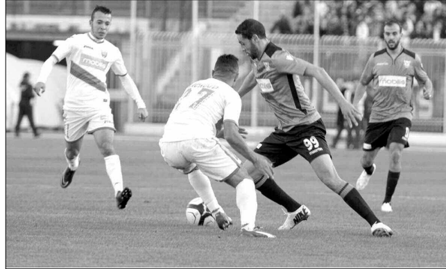
وفاق سطيف - إتحاد بلعباس شباب بلوزداد - جمعية عين مليلة مولودية الجزائر - نادي بارادو