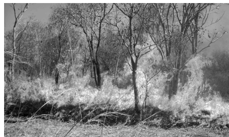
الغربية بـ 44 حريقا ما تلف 61 هكتارا، والمناطق الوسطى بـ 58 حريقا تلف 38 هكتارا (الغربية بـ 44 حريقا ما تلف 61 هكتارا، والمناطق الوسطى بـ 58 حريقا تلف 38 هكتارا) كما تجدر الإشارة، إلى أنه خلال الأسبوع الممتد بين 12 و18 جويلية تم تسجيل 72 حريقا شمل مساحة إجمالية تقدر بـ 97 هكتارا، منها 31 هكتارا من الأذغال و42 هكتارا من

تسببت حرائق الغابات في إتلاف مساحة 462 هكتار، وذلك في الفترة الممتدة بين الفاتح جوان إلى غاية 18 جويلية الجاري. وحسب حصيلة المديرية العامة للغابات تم تسجيل 136 حريقا شمل مساحة إجمالية تقدر بـ 462 هكتار، منها 328 هكتار من الغابات و52 هكتارا من الاحراش و82 هكتارا من الأذغال، أي بمعدل 3 حرائق يوميا ومساحة 3.39 هكتار لكل حريق.