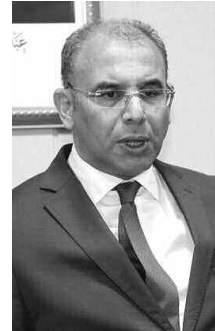
وردا على مدى تقدم أشغال إنجاز مشروع المحطة الجوية الدولية

وخلال هذا اللقاء، الح السيد زعلان على ضرورة التنسيق المحكم بين جميع المتدخلين لإيجاد الحلول في وقتها والعمل على تسريع وتيرة الإنجاز لكي يتم تسليم المشروع في آجاله المحددة، كما أكد على وجوب الاستعداد لمرحلة استغلال