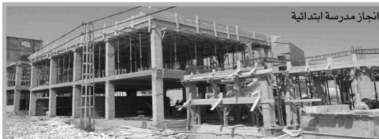
إنجاز مدرسة ابتدائية

ستتدعم بلدية مغنية في مجال قطاع التربية والتعليم مع الدخول المدرسي المقبل، بـ 04 مؤسسات تربوية للتعليم الابتدائي من نوع (صف ب1) و 06 أقسام، حيث ستتمكن هذه المشاريع من تخفيف الضغط على المدارس الأخرى المجاورة لها، وتحسين ظروف تدرّس التلاميذ على مستوى كل من الحي السكني بالقرب من حي (د.ن.س) أمام الثانوية رقم 03 المعروفة باسم الشهيد "بوعزة الميلود" التي انتهت بها الأشغال، وهي في المسات الأخيرة لتجهيزها، والثالثة، بحي الجرابية المعروف بـ (دوار البحيري).