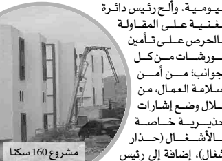
مشروع 160 سكنا

بشّر رئيسا دائرة بلدية مغنية المستقيدين من برنامج 160 سكنا تساهميا بحي عمر، باستلام مفاتيح سكناتهم من قريب، وهذا بعد معاناتهم من توقف المشروع بسبب الجدار الواسع للسكنات، مما جعلهم يفقدون الأمل في استلام سكناتهم في أجالها المحددة طبقا لدفتر الشروط المنصوص عليه في الإنجاز، وهو ما صرح به رئيس دائرة مغنية لـ "المساء"، وهي بشرى سارة لكافة المواطنين المستقيدين من البرنامج، وهو فرح جاء بعد أن عرف المشروع تأخرا، حيث تم تعيين المقاول بقرار شجاع من الوالي، الذي قرر تكليف مؤسسة عمومية تتكفل بإنجاز حائط السند أو الجدار الواسع من الأمطار وانجراف التربة الذي كان يشكل عائقا كبيرا لاستكمال المشروع، إذ أن كافة عملية التهيئة مبرجمة، والمقاولات المكلفة بها معيّنة، ولم يبق إلا