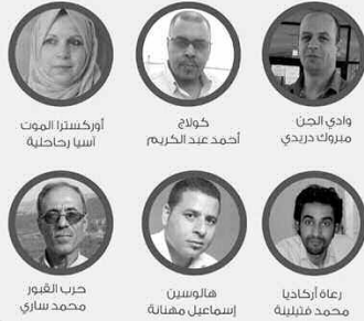
أسيا راجاحلية أوركسترا الموت خولاج أحمد عبد الكريم وادي الجن مبروك دريدي هالوسين إسماعيل مهناة رعاة أركاديا محمد فتيلينة حرب القبور محمد ساري