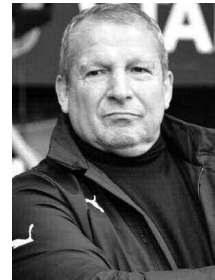
الفرنسي لمتابعة تشكيلة العمد عن قرب.

يُتَظَن أن يحسم المدرب الفرنسي رولان كوريس اليوم موقفه النهائي بخصوص العرض الذي قدم له من طرف إدارة فريق مولودية الجزائر بخصوص توليه الإشراف على العارضة الفنية للعمد خلفا لمواطنه برنارد كازوني.