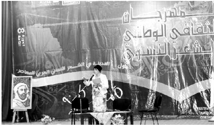
لوانه على غرار العمودي، التفعيلة الوطنية، على أن تكون المشاركة باللغة العربية في الشعر الفصيح بمختلف الجارية واللواتي يشاركن من داخل 18 سنة، إلى غاية 31 ديسمبر من السنة