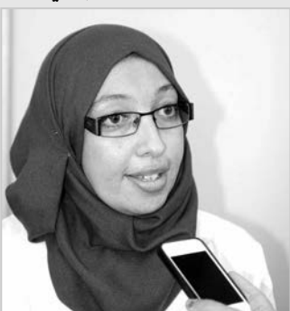
الأخصائية النفسانية بلشير

العائلة يختلف عن التي لا تعرفه، والأمير يختلف أيضاً بين إنكار الزوج أو قبول حالة المريضة، فالحالة النفسية لمن وجدت السند الاجتماعي ليست مثل التي تم تخلي عنها وتذهب بمفردها للعلاج، وهو ما يؤثر على حالتها النفسية، خاصة خلال مرحلة العلاج الإشعاعي: حيث تستوجب المساعدة بعد حالة التعب والوهن التي تصيب المعالج، فالدعم النفسي والاجتماعي للمريضة وسبل أفراد أسرتها ومحيطها المهني، ضروري، لأنها إذا لم تجد المساعدة والسند فإن تصرح لأي كان بمرضها، لكن إذا وجدت السند استطاعت أن تتصور المرض بإيجابية، إذ تراه مرضاً زمنياً وليس قاتلاً، لأن هناك سيدات يعشن 20 سنة بالمرض، وغالباً ما تكون المرأة في نفسية جيدة إذا لقيت السند المعنوي والمادي من زوجها".