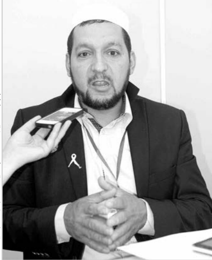
ياسن أ. (جمعية الإشراف - غرداية)

تحدثت "المساء" إلى العديد من الجمعيات الناشطة في مجال محاربة السرطان في مختلف ولايات الوطن، للتعرف على مشاكل ومعاناة المرضى مع الداء، خاصة أنه يعد من الأمراض الثقيلة وباهظة العلاج، حيث أكد المشرفون عليها، والذين يحثون يوميا مع المرضى، أن هناك سيدات ينتظرن منذ سنة إجراء "الماموغرافي" ببشار ولم يحن بعد موعدهن، ومريضات تضطر الجمعية إلى أخذهن من البيوت لمباشرة العلاج في المناطق النائية بتبليزة، في حين يعاني مرضى غرداية من انعدام المراكز وبعد المسافة. أحلام محي الدين