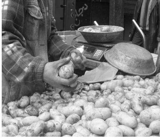
المدينة الجديدة بونيان (البلدية)