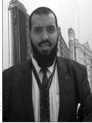
ممثل فنادق زهرة السعد