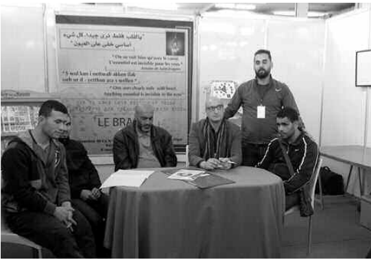
جانب من النشاط

الأمازيغية بالتعاون مع المحافظة السامية للغة الأمازيغية، تمكنه من طبع كتب البراي، خاصة أنها غير موجودة بكثرة في السوق، معتبرا أن إصدار كتاب البراي في حلة جميلة، مهم؛ فليس أفضل من صنع منتج يهني، وبالمقابل، وزع أمالو كتب البراي في الجزائر وفي مدن مختلفة من فرنسا.