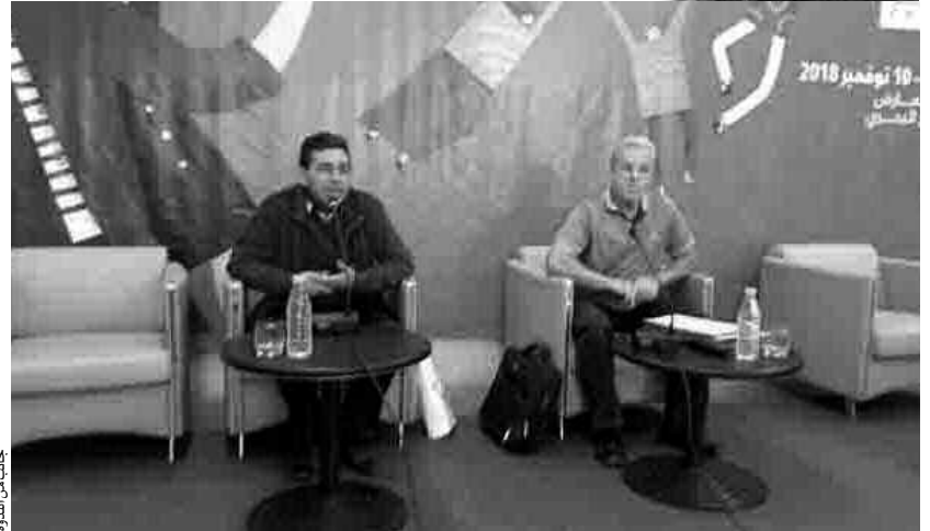
جانب من النقاش