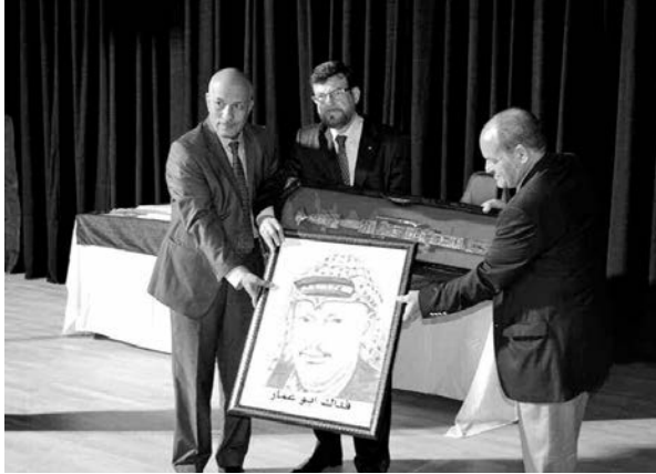
سفير دولة فلسطين عيسى نوي لـ «المساء»: