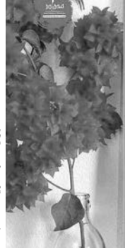
غلاف رواية «امرأة سريعة العطب».

وعاد واسيني ليؤكد أن صورة الأمير أكبر من جهل الذين يريدون حجزه داخل الصورة التي صنعوها له، وهي صورة تحكمها الإيديولوجية التفعية بالمنع الديني أو السياسي، معتبراً أن الأمير كما الأميرة (أبواب الحديد)، رواية تحور الشخصية من قيود التاريخ المصنّع، وتذهب بها نحو تاريخ آخر، ينشأ جزء كبير منه في عمق المتخيل.