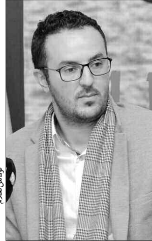
لونا س لعلا م