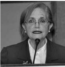
لجنة الشؤون القانونية والتربية والبرقيات تنظم بومعينة الجزائر دور البرلمان ترقية حقوق الإنسان وحمايتها

الاعتناق، لا يزال يشكل اليوم مطلباً لدى بعض الدول، كونها لا تزال قابعة تحت نير الاحتلال، حيث ذكر في هذا الشأن بفلسطين والصحرى الغربية، اللتان لا تزالان تناضلان من أجل العيش بكرامة وإنسانية، مشيراً إلى أن الجزائر تبنت في مختلف مساعيها وتشريعاتها قواعد ومبادئ حقوق الإنسان، المتوافقة مع التزاماتها الدولية في هذا المجال.