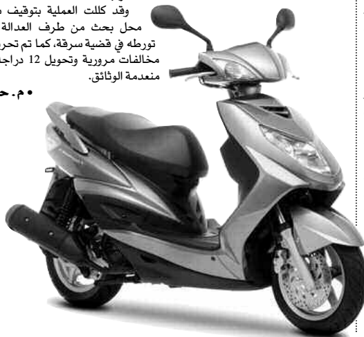
سور الغزلان (البويرة)