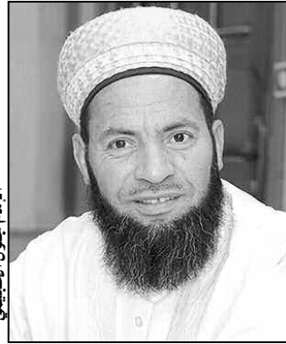
الإمام جلول قسول

من جهة يرى الإمام جلول الحجي أن المرأة الجزائرية لها جذور عريقة، وتملك من المؤهلات والأصول العريقة ما يجعلها تحافظ على مبادئها وثوابتها، يقول «يكفي