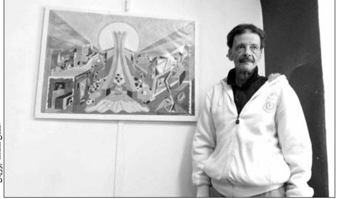
الفنان عكاشة بوزيان

الفردية للأمور، فيرسم فنانين عدة بورتريهات للعارض الواحد.