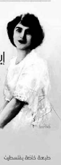
طبعة خاصة بفلسطين

مي ليالي إيزيس كوبيا ثلاثمائة ليلة وليلة في جديم العصفورية