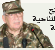
قائد صالح في زيارة للناحية العسكرية الثانية