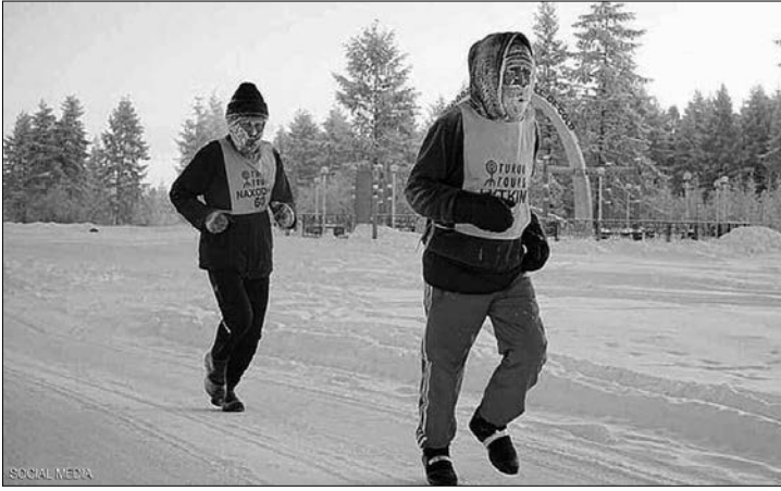
الماراثون المثير، بعدما ظل ماراثون بريطاني أقيم في 27 درجة تحت الصفر أبرد سباق في العالم، إلى غاية تنظيم المنافسة الروسية الأخيرة.