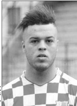
مضيفان و مشاور