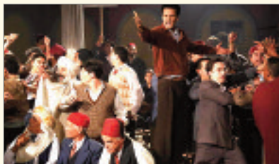
بين الطرفين منذ البداية. والبحوث في الحركة الوطنية وأضاف أن مركز الدراسات وثورة أول نوفمبر 1954،

المكلف بمتابعة الأفلام والأفلام الوثائقية حول ثورة التحرير الوطنية (1954-1962)، أبدى تحفظات فيما يتعلق بمحتوى الفيلم ومعالجته لبعض الأحداث. وفيما يخص فيلم "سي محمد أومحمد"، أخرجه على موزايي، أكد وزير الثقافة أن مصالحة سوف تجند كل الوسائل الضرورية المادية والمالية من أجل إنجاز هذا المشروع "الذي يساهم في الحفاظ على الثقافة والذاكرة التاريخية للجزائر".