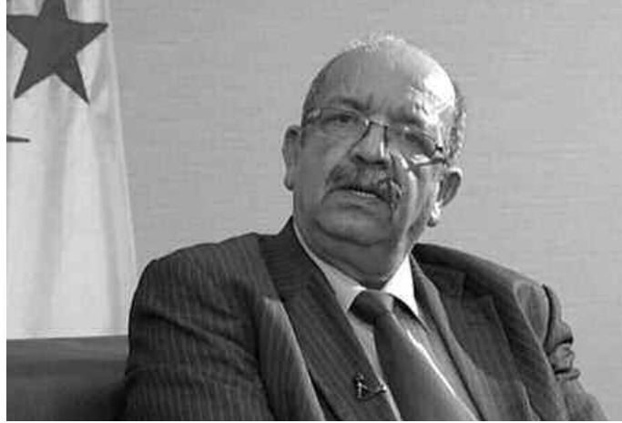
عالم أكثر أمنا.

ووافق الوزيران على مواصلة التشاور بغية تنفيذ القرارات المنبثقة عن هذه الزيارة، خصوصا المجلس الأعلى الجزائري - السعودي حول التنسيق برئاسة الوزير الأول، أحمد أوجحي وولي العهد من أجل "تدعيم التعاون في المجال السياسي والأمني ومكافحة الإرهاب والتطرف، إضافة إلى الجانب الاقتصادي والتجاري والاستثمار والطاقة والحديد والصلب كما تبادل الجانبان، وفقا لنفس المصدر، الآراء حول القضايا الإقليمية والدولية ذات الاهتمام المشترك، لاسيما الوضع في العالم العربي، حيث جدد في هذا الشأن التزامهما على مواصلة الجهود من أجل إصلاح جامعة الدول العربية قصد تكيفها مع التحديات والتحديات التي يواجهها العالم العربي.