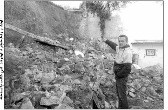
من حسن الحظ لم تكن هذه البراءة بساحة المنزل المردومة

وتناشد السكان السلطات المعنية وعلى رأسها مدير أمن الولاية، ضرورة التدخل العاجل لوضع حد نهائي لظاهرة السرقة والاعتداءات المتكررة التي يتعرضون لها والتي يقفون حيالها عاجزين، مؤكدين أن وضع هذا الحي الذي استقطب العديد من العائلات المرحلة بصيغة "عدل"، أصبح