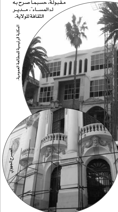
المكتبة الرئيسية للمطالعة العمومية.