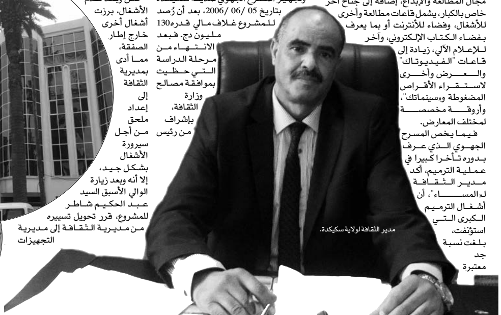
مدير الثقافة لولاية سكيدة.

فيما يخص المسرح الجهوي الذي عرف بدوره تأخرا كبيرا في عملية الترميم، أكد مدير الثقافة له المساء، أن أشغال الترميم الكبرى التي استؤنفت، بلغت نسبة جدد معتبرة.