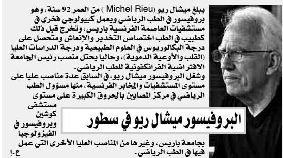
البروفيسور ميشال ريو في سطور

الوكالة الفرنسية لمكافحة المنشطات، وضعت حيز التطبيق وحدة تعليمية توضح الطرق والوسائل التي يجب أخذها بعين الاعتبار لمكافحة تناول المنشطات. كم عدد المؤتمرات التي نظمتموها أو