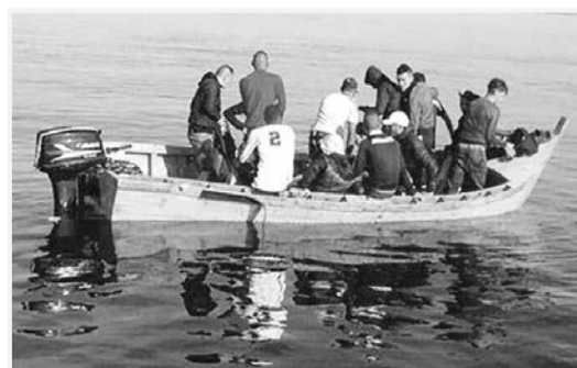
قيادة الدرك الوطني، جملة من

من جهة أخرى، أوضح المتحدث أن مناطق الهجرة التي يقصدها الحارقة، تحولت إلى مراكز تجارية يستثمر فيها تجار الموت، وتعمل مصالح الدرك الوطني على محاربتها، وتدعو، بالمناسبة، المواطنين إلى التحلي بثقافة التبليغ عن طريق