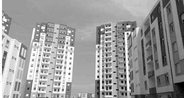
صورة من الأراضي