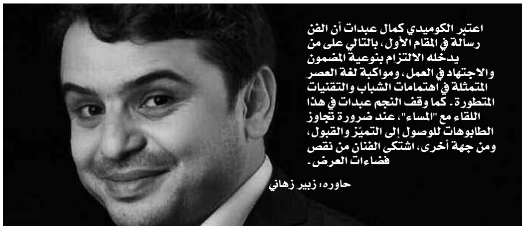
حاورہ: زبیر زہانی

• ما هي رسالتك للشباب المولوع بالفن؟ أنصحهم بالمثابرة في العمل والاجتهاد، فنحن لم نجد الطريق معبداً، لقد تعبنا كثيراً خلال مشوارنا الفني قبل أن نصل ونقدم أعمالنا عبر التلفزيون، أنصحهم بالصبر وعدم اليأس، وأن يضعوا في أذهانهم فكرة واحدة تتمثل في كيفية تقديم عمل مميز يحسن من صورة الفن الجزائري في الداخل والخارج.