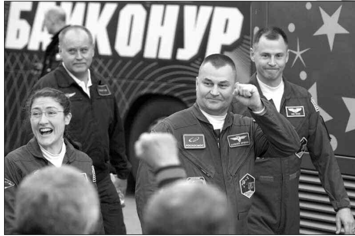
أعلن جيم بریدنستين مدير إدارة الطيران والفضاء الأمريكية (ناسا)، أن امرأة على الأرجح، ستكون أول كائن بشري يخطو على سطح المريخ، وفقا لما نقلته شبكة "سي.أن.أن".

شددت ماكنتاير على أن المرأة ينبغي أن تكون "في الطليعة، إذا أرسلت ناسا أولى بعثاتها البشرية إلى المريخ"، مبدية تعجبها من "مرور أكثر من نصف قرن منذ أن أرسلت روسيا أول امرأة إلى الفضاء، ومرور 40 عاما على اختيار ناسا أول رائدة فضاء، بينما لم تصل امرأة إلى سطح القمر، ويقتصر حضور المرأة على صناعات العلوم والهندسة".