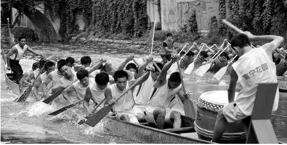
عيد قوارب التنين

إضافة عصير عشب (الشيح) الذي يغطي بشكل كامل على طعم الأرز. كما يحتفل الصينيون بعيد متنصف الخريف الذي يعني أيضاً "عيد البدر"، في اليوم الخامس عشر من الشهر القمري الثامن، الذي يصادف أواسط فصل الخريف، ومنه استمد العيد اسمه، فقد كان الصينيون قديماً يقدمون لآله القمر قرايين من الكعك الفاخر، ثم يوزعونه على كل أفراد الأسرة، كرمز لالتئام الشمل، ومازالت هذه العادة شائعة بينهم إلى غاية اليوم.