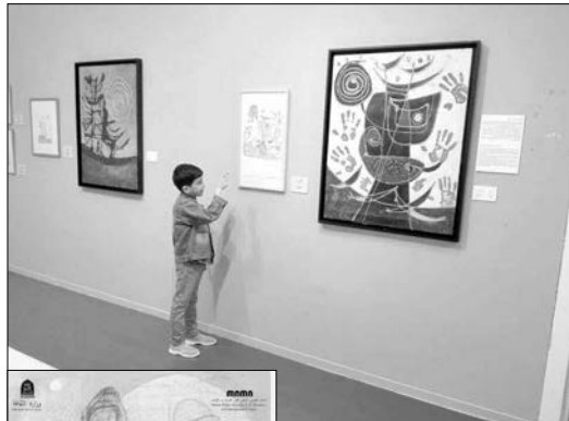
جانب من المعرض