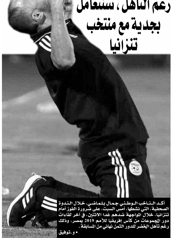
أكد الناخب الوطني جمال بلماضي، خلال الندوة الصحفية، التي نظمتها، أمس السبت، على ضرورة الفوز أمام تنزانيا، خلال مواجهة ضدهم غدا الاثنين، في آخر لقاءات دور المجموعات من كأس إفريقيا للأمم 2019 بمصر، وذلك رغم تأهل الخضر للدور الثمن النهائي من المسابقة. • وتوفيق

مضيفا: "على الرغم من وجود العديد من المنتخبات القوية، إلا أننا جاهزون تماما للعب مع أي فريق، ومن خلال أدائنا في المباريات فقط، يمكننا القول إن كنا مرشحين للفوز بالكأس". من جهته، رفض بلماضي الحديث عن وجود لاعبين أساسيين واحتياطيين في تشكيلته، مؤكدا أنه لا يوجد 11 لاعبا أساسيا و 12 بديلا في لقاء الخضر المقبل ضد تنزانيا، مشيرا كل اللاعبين معنيين بها وعلى كل عنصر أن يكون جاهزا للمشاركة في أي لحظة.